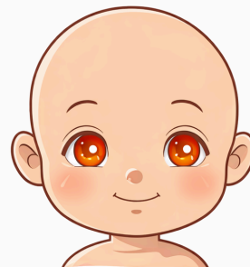
REFLEXO DE OLHO VERMELHO NORMAL

A ausência de reflexo, a assimetria entre os olhos ou a presença de áreas esbranquiçadas podem indicar alterações como catarata congénita, retinoblastoma ou opacidades dos meios oculares.